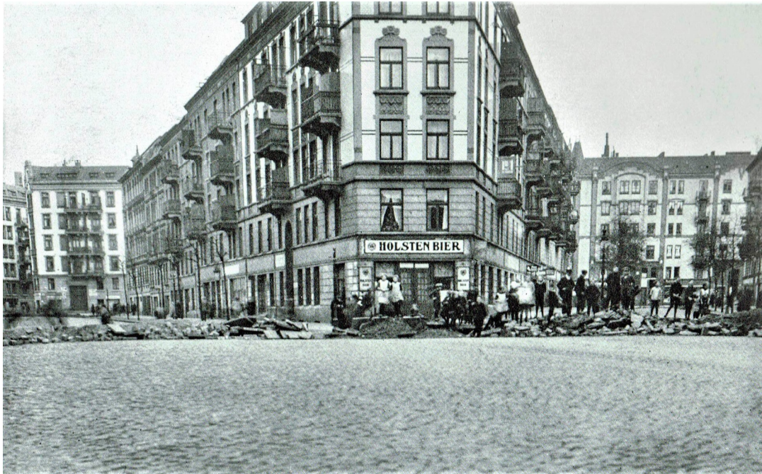
Hamburger Aufstand 22./23. Oktober 1923: Straßenbarrikade in Hamburg-Barmbek

C:\Users\thomas\Nextcloud\Goliatwatch\Bildung\Rundgänge\Rundgang Barmbek Arbeit Geld oder Leben