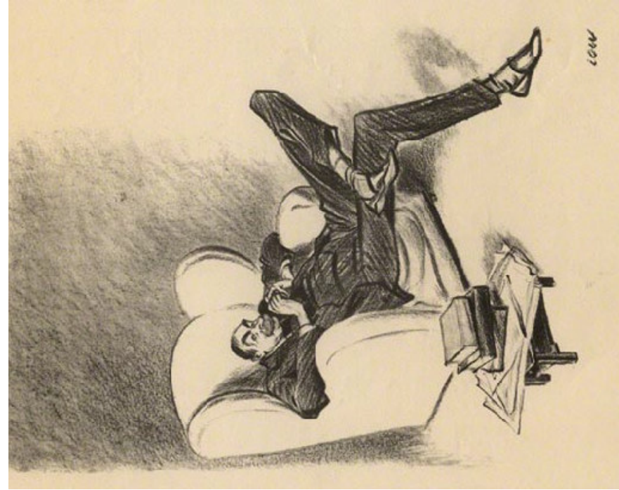
Karikatur von John Maynard Keynes (5 June 1883 – 21 April 1946)