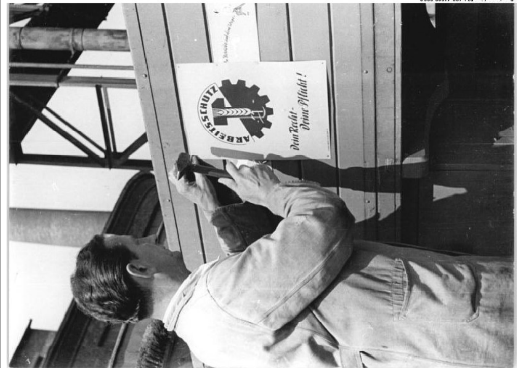
27. August 1998